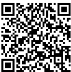
Google Play Store